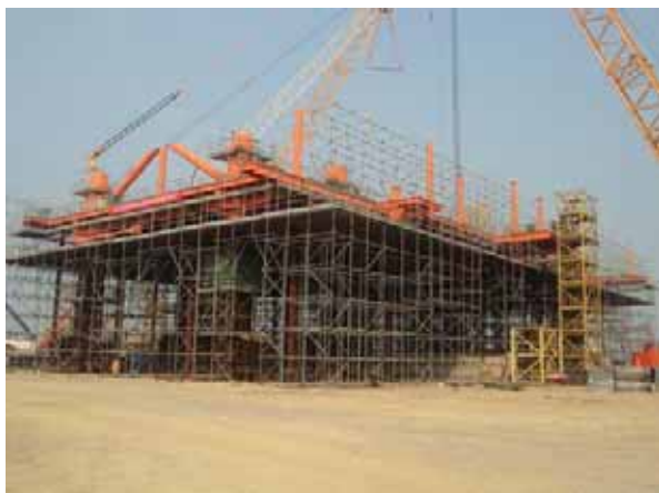
惠州DPP25-8組塊18.5米甲板吊裝完畢