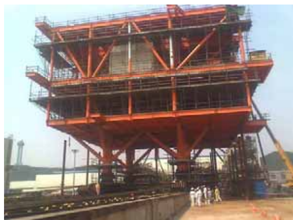
番禺WHPA10-2組塊二次牽引圖