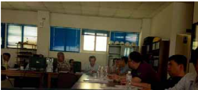
Weekly Progress Meeting in CPC office with CPC and VO staff

I worked with POE for the first time in the summer of 2013 on the Shalung Offshore Pipeline Replacement Project based in Taiwan. The project entailed the removal of an existing 42 inch PLEM and 150m of existing 42 inch crude oil pipeline, pre-dredging for the new pipeline, installation of a new 42 inch crude oil pipeline and 42 inch PLEM, backfilling of the new pipeline, and pre-commissioning activities. When I arrived, I was overwhelmed by the warm welcome from POE and CPC staff. At the beginning, I spent my time attending meetings between Van Oord and CPC as a representative from POE. Topics of these meetings included engineering procedural review and payment applications. Although the project encountered a few challenges, everyone managed to work together to lay the pipeline. At the beginning of August, I boarded the Shallow Water Pipe Lay Barge 'Stingray' in order to monitor the pipe lay progress. While on board, I witnessed the removal of the 42 inch PLEM and the installation of approximately ½ the total length of the new pipeline lay. Attached below are some pictures of the time I spent in Taiwan. I hope I can work with POE in the future and visit Taiwan again!