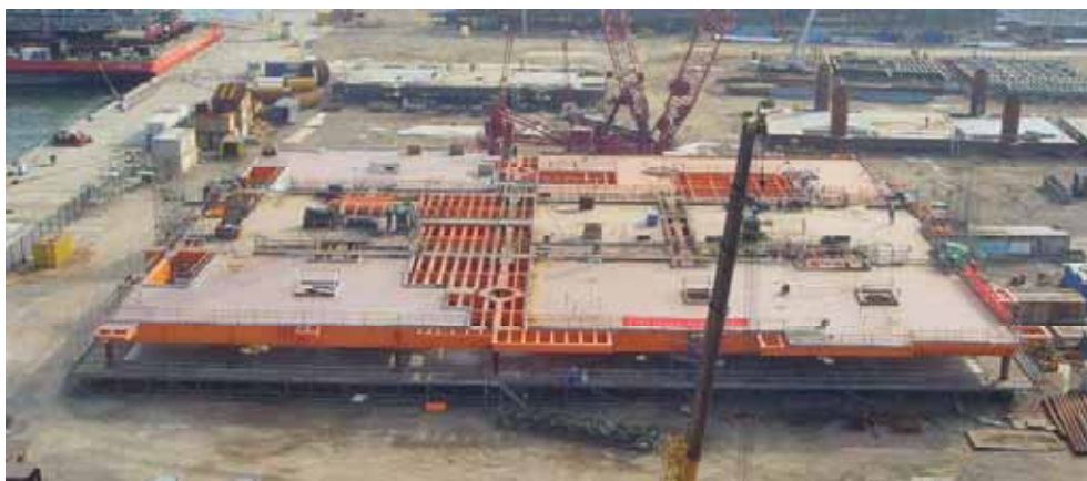
LF7-2 DPP組塊 19米水準片總組完成