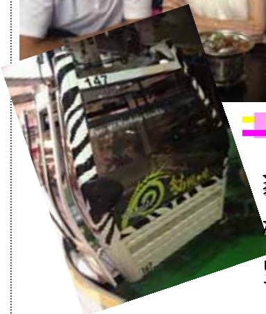
貓空水晶纜車(地板使用水晶面板能望見到下方景色)