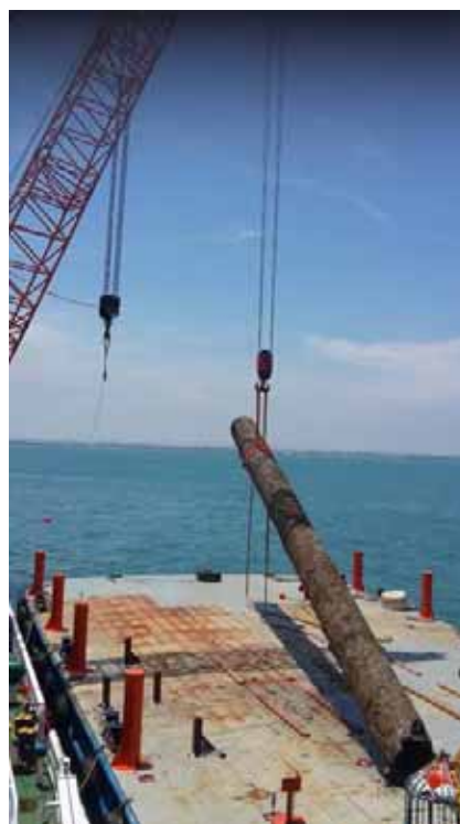
Removal of 42-inch Pipeline