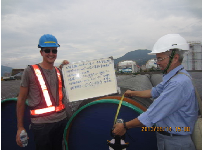
POE 黃組長和VO的QC對海底管線的混凝土塗層進行抽檢