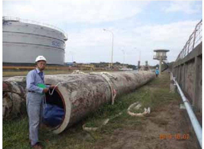
POE 黃組長對打撈上來的舊管進行測量