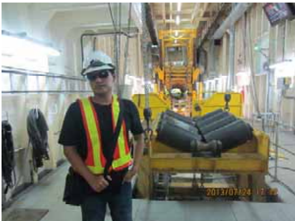
Atta 進行佈管設備查驗