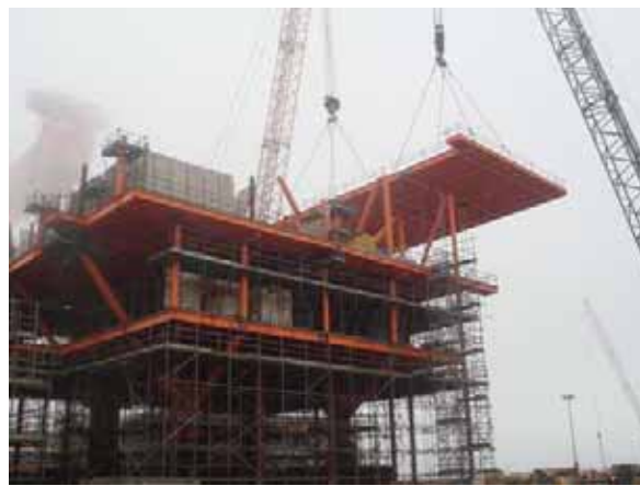
番禺WHPA10-2組塊5#片吊裝圖