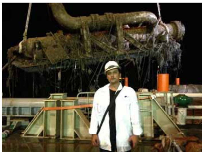
Atta 進行PLEM拆除的現場監造