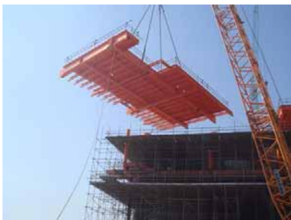
惠州DPP25-8組塊15#片吊裝圖