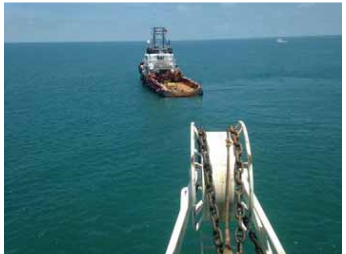
POE 監督拖輪為鋪管船進行拋錨