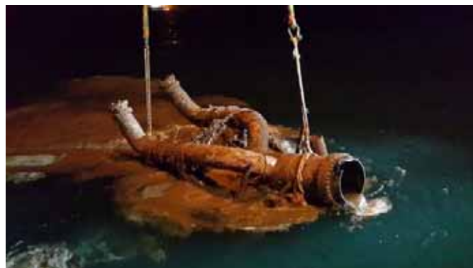
Removal of 42-inch PLEM