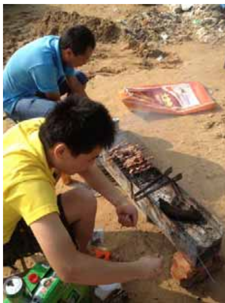
燒烤隊伍兩人一組~