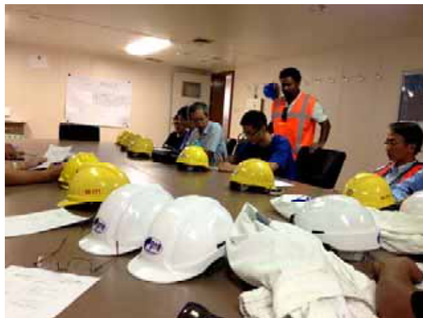
POE and CPC safety induction on board the Stingray