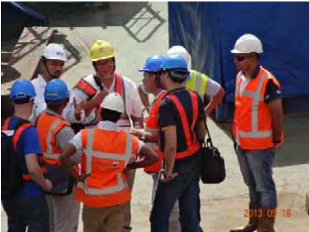
sam在佈管船上與VO人員進行討論