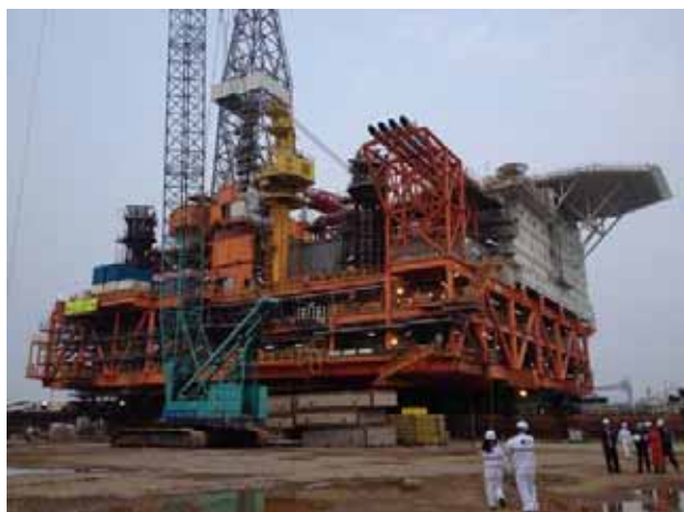
裝船完畢，準備出發