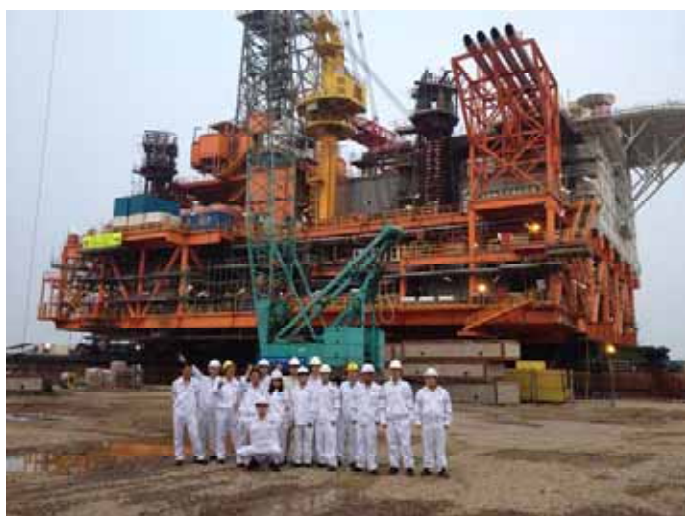
POE加設團隊在組塊前合影