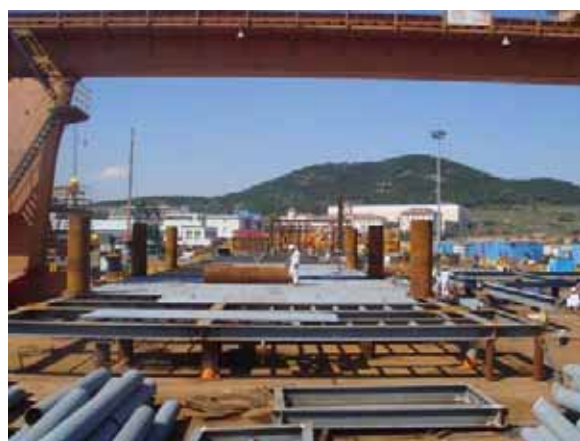
惠州DPP25-8組塊生活樓預製現場圖